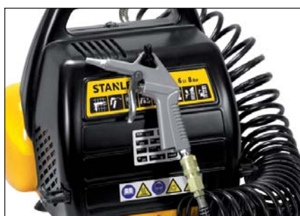
Accessori non inclusi.