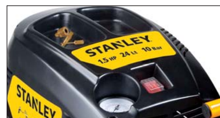
Accessori non inclusi.