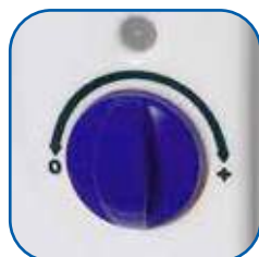
Variatore di intensità luminosa.

La lampada si accende automaticamente in caso di black-out elettrico.