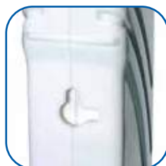
Asole per appendere la lampada ad una superficie verticale.