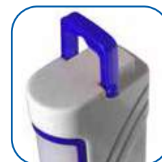
Piccola maniglia a scomparsa per trasportare o appendere la lampada.