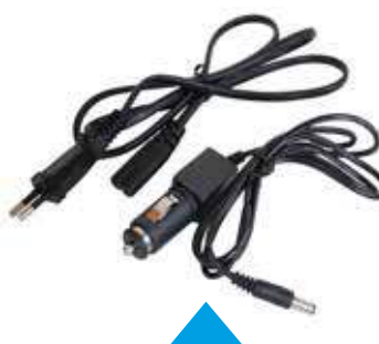
2 Caricabatterie: 220 V e 12 V