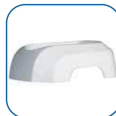
Basamento per sostenere la lanterna in posizione verticale.