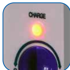
Luce spia indicatore di ricarica batteria e della funzione emergenza inserita.